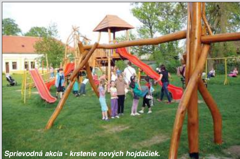
Sprievodná akcia - krstenie nových hojdačiek.