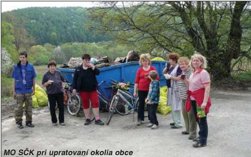
MO SČK pri upratovaní okolia obce