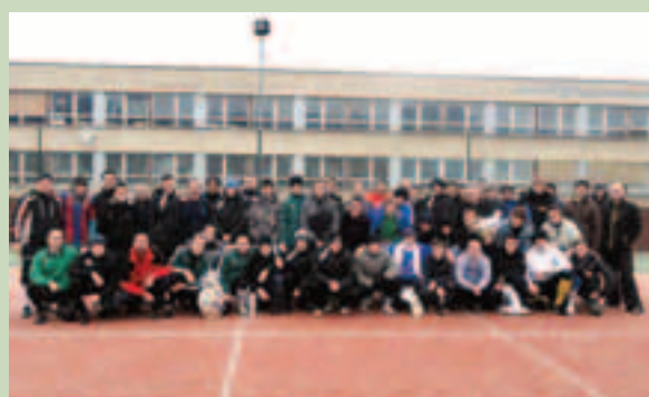
Učastníci Štefanského futbalového turnaja