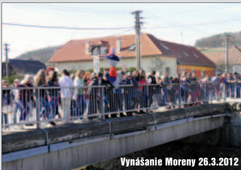
Vynášanie Moreny 26.3.2012