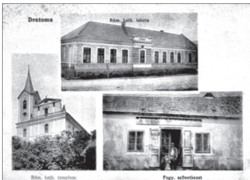
Pohľadnica Drietomy zo začiatku 20. storočia